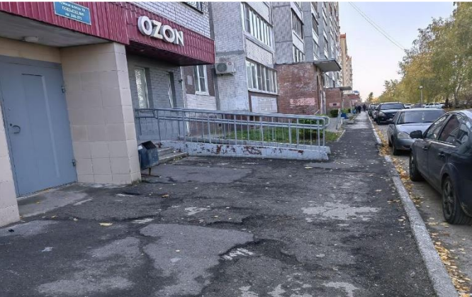
Фото объекта «ДО»

Департамент гор. хозяйства: Стражец Н.С. Т.54-31-68