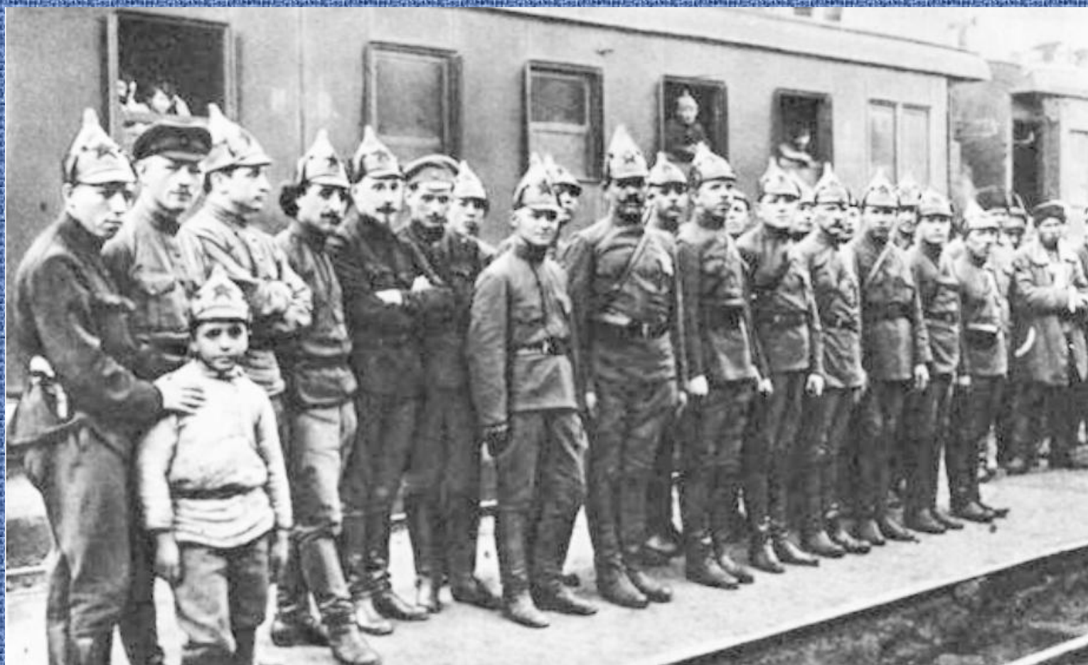
Тухачевский, Фрунзе, Кобзев у захваченного поезда Каледина.1919