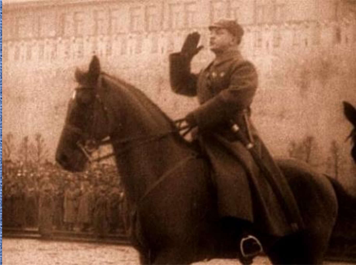
Маршал М.Н.Тухачевский принимает военный парад