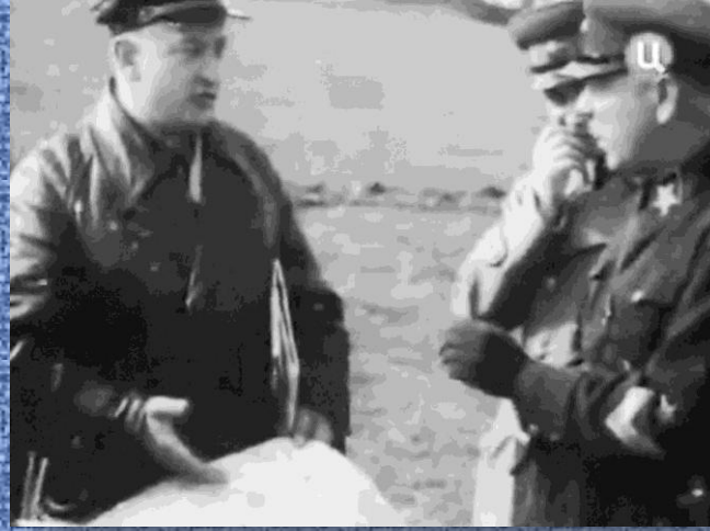
Тухачевский на военных учениях.