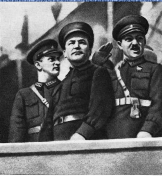
Тухачевский, Киров и Микоян.