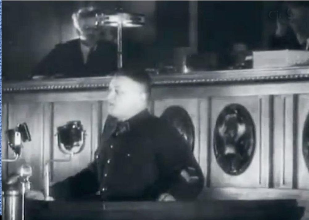
На совещании командиров РККА