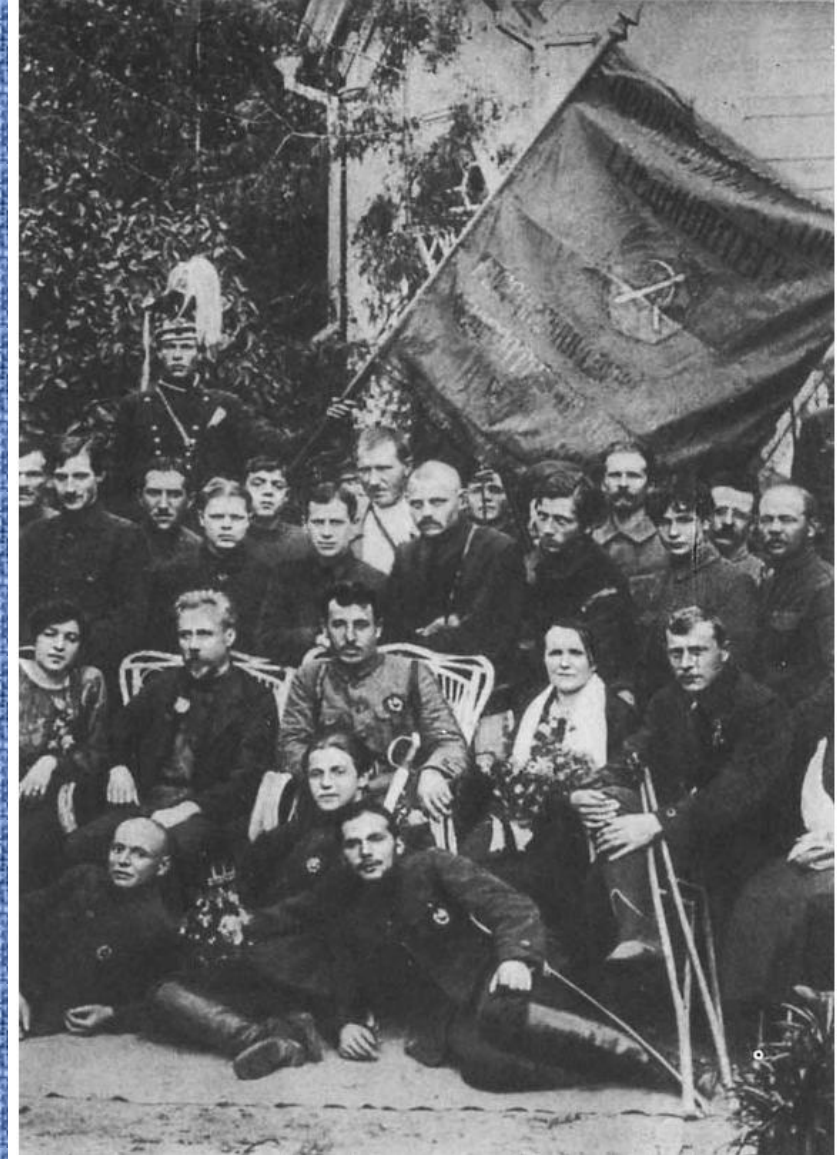
Штаб 24-й Симбирской железной дивизии Г.Д.Гая. 1918