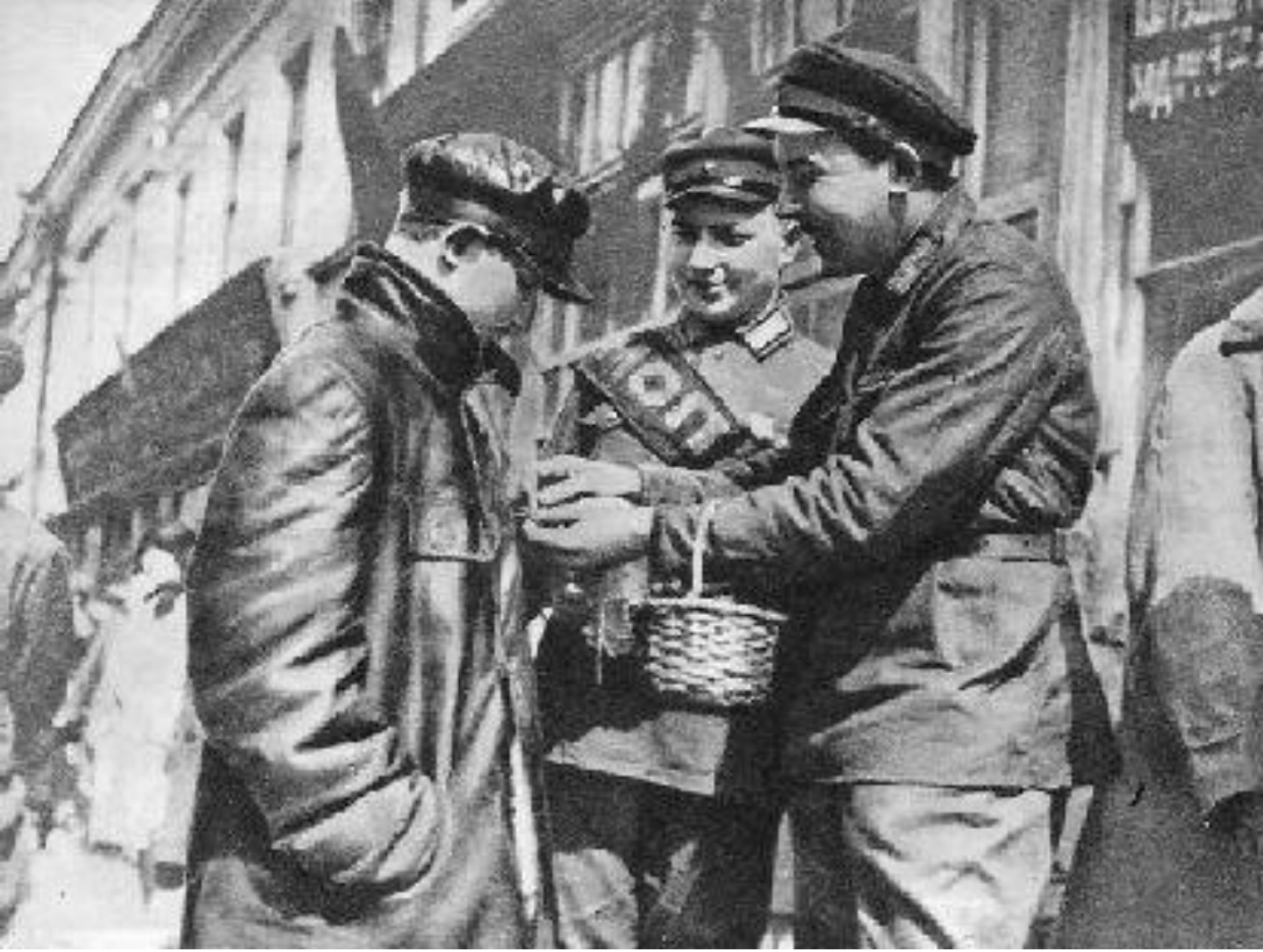
На празднике МОПР. 1920