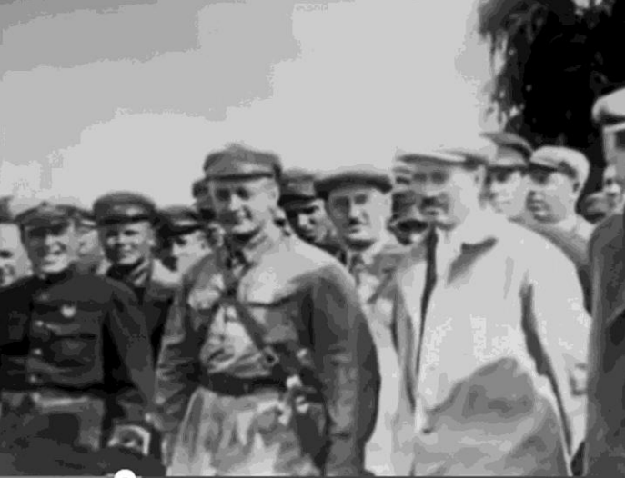
Тухачевский и Мехлис