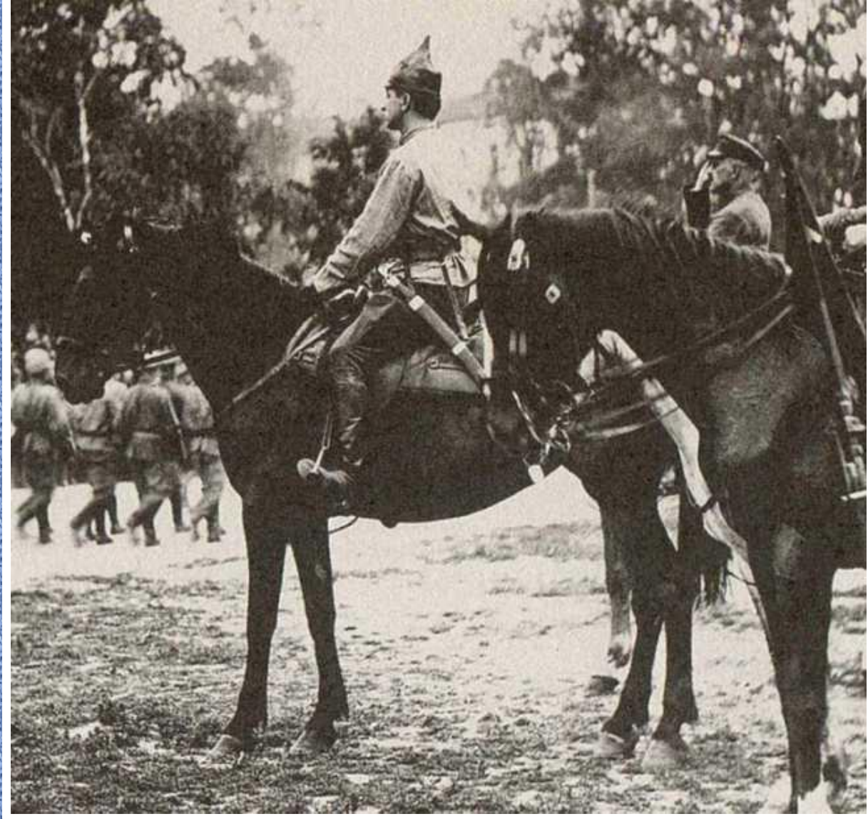
Тухачевский в кавалерийском полку