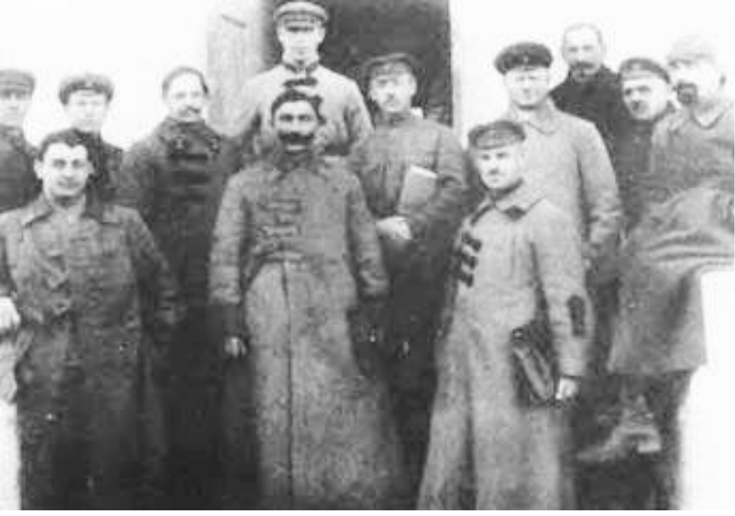
Тухачевский, Буденный. 1919 г.