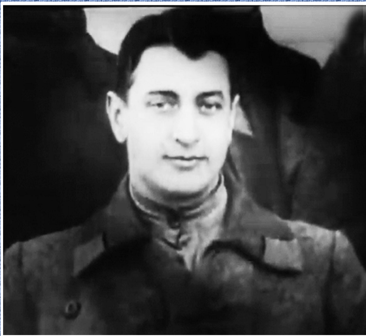
Командующий 5-й армией Восточного фронта М.Н.Тухачевский