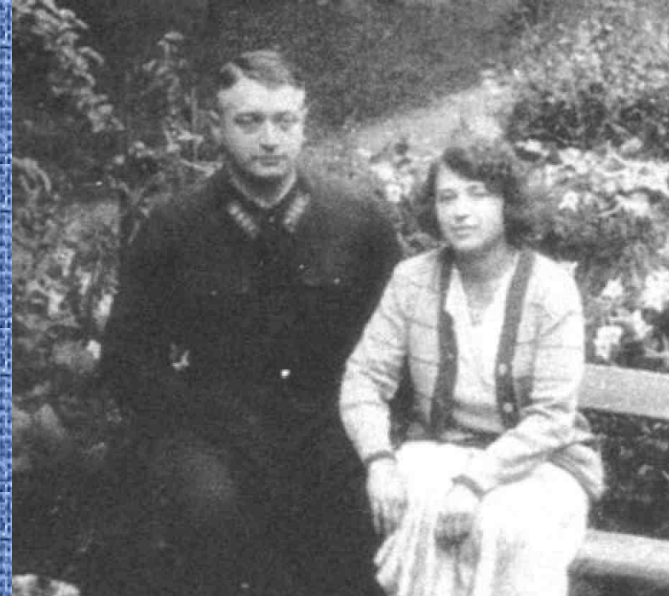
С женой и дочерью