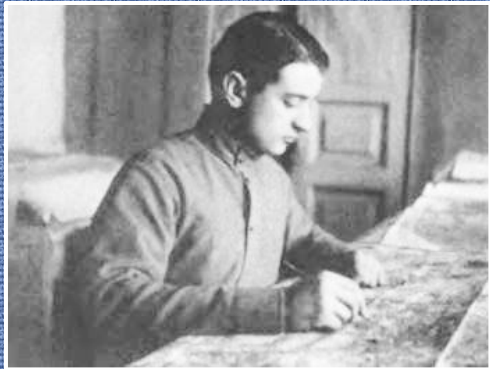
М.Н.Тухачевский в штабе 5 армии Восточного фронта.1918