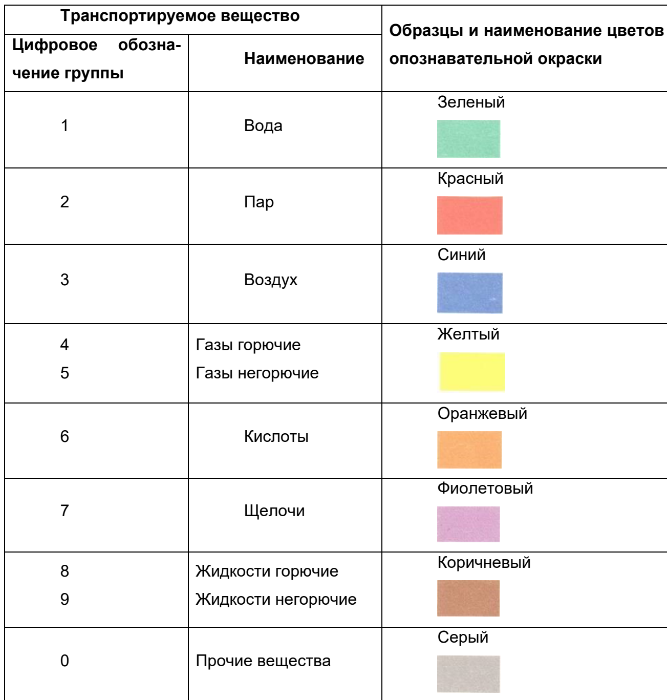
Таблица 3.11.1 — Опознавательная окраска и цифровое обозначение укрупненных групп трубопроводов

Противопожарные трубопроводы, независимо от их содержимого (вода, пена, пар для тушения пожара и др.), спринклерные и дренчерные системы на участках запорно-регулирующей арматуры и в местах присоединения шлангов и других устройств для тушения пожара должны окрашиваться в красный цвет (сигнальный).