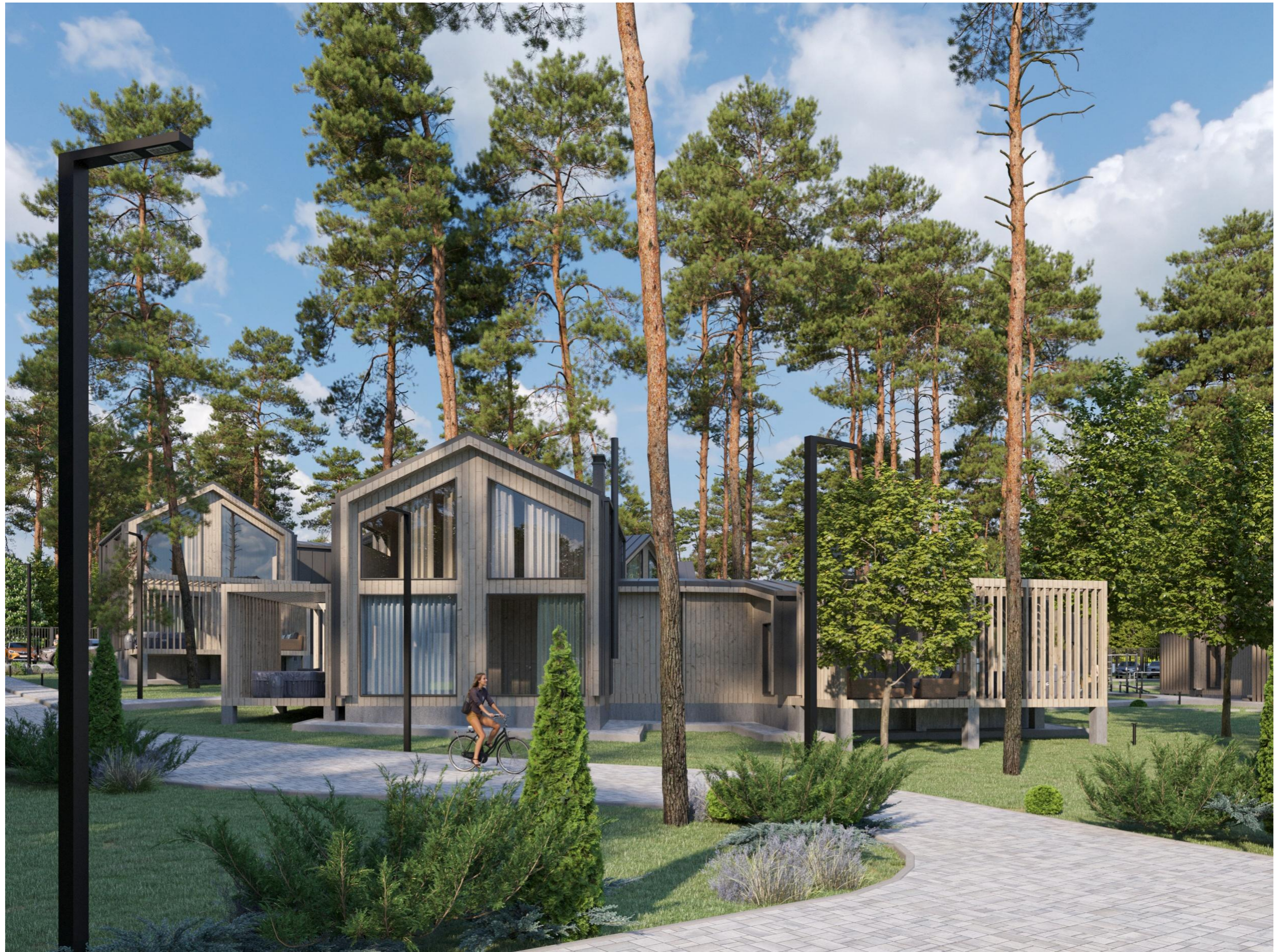
Перспективное изображение Вид 2