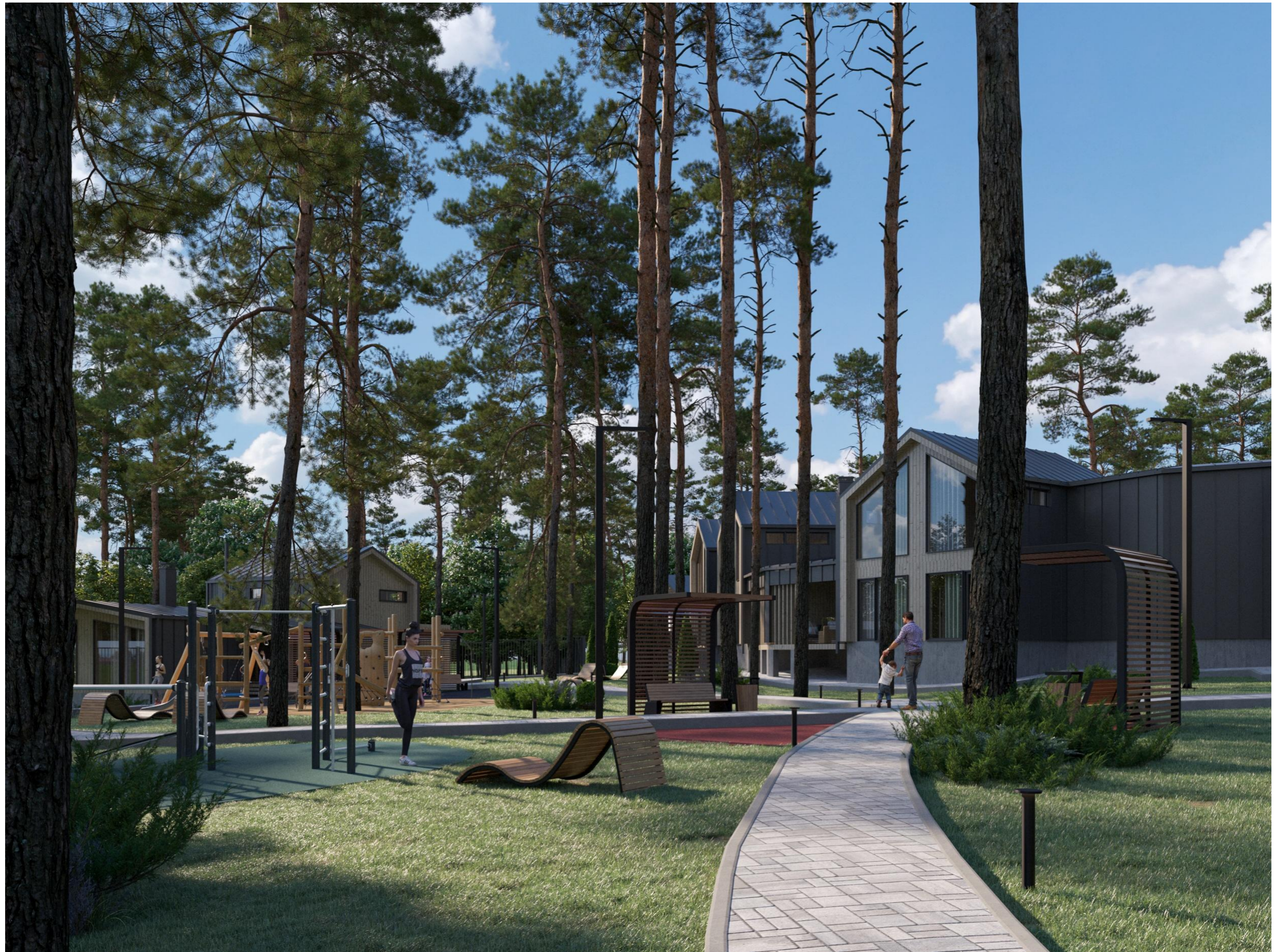
Перспективное изображение Вид 9