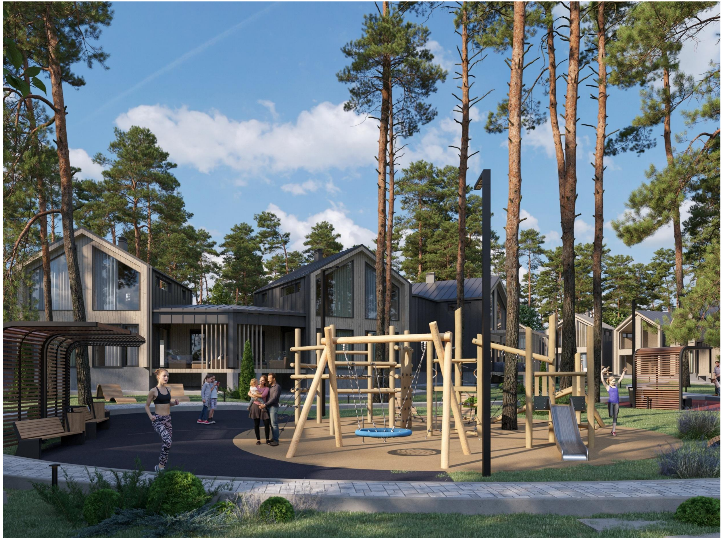
Перспективное изображение Вид 10