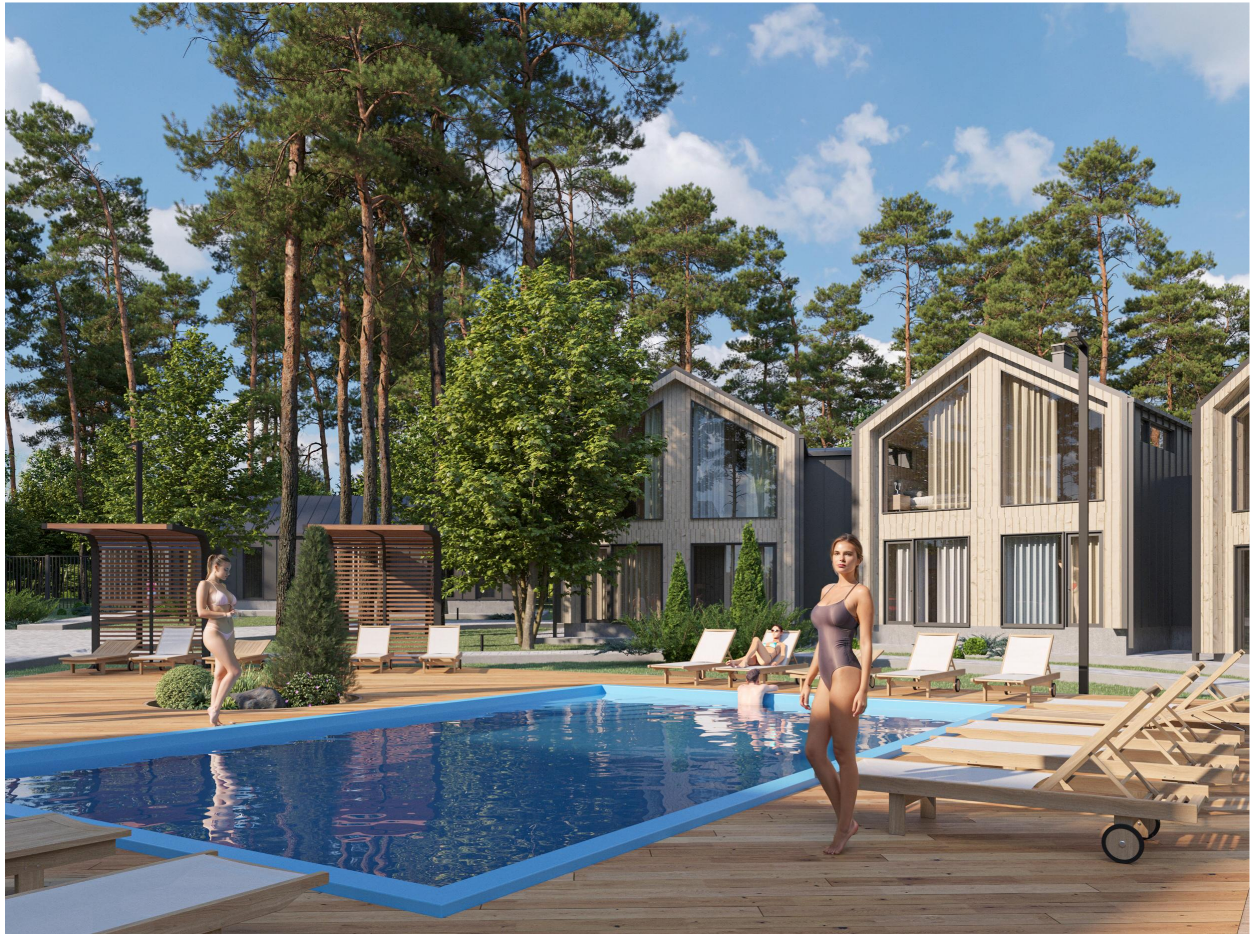
Перспективное изображение Вид 5