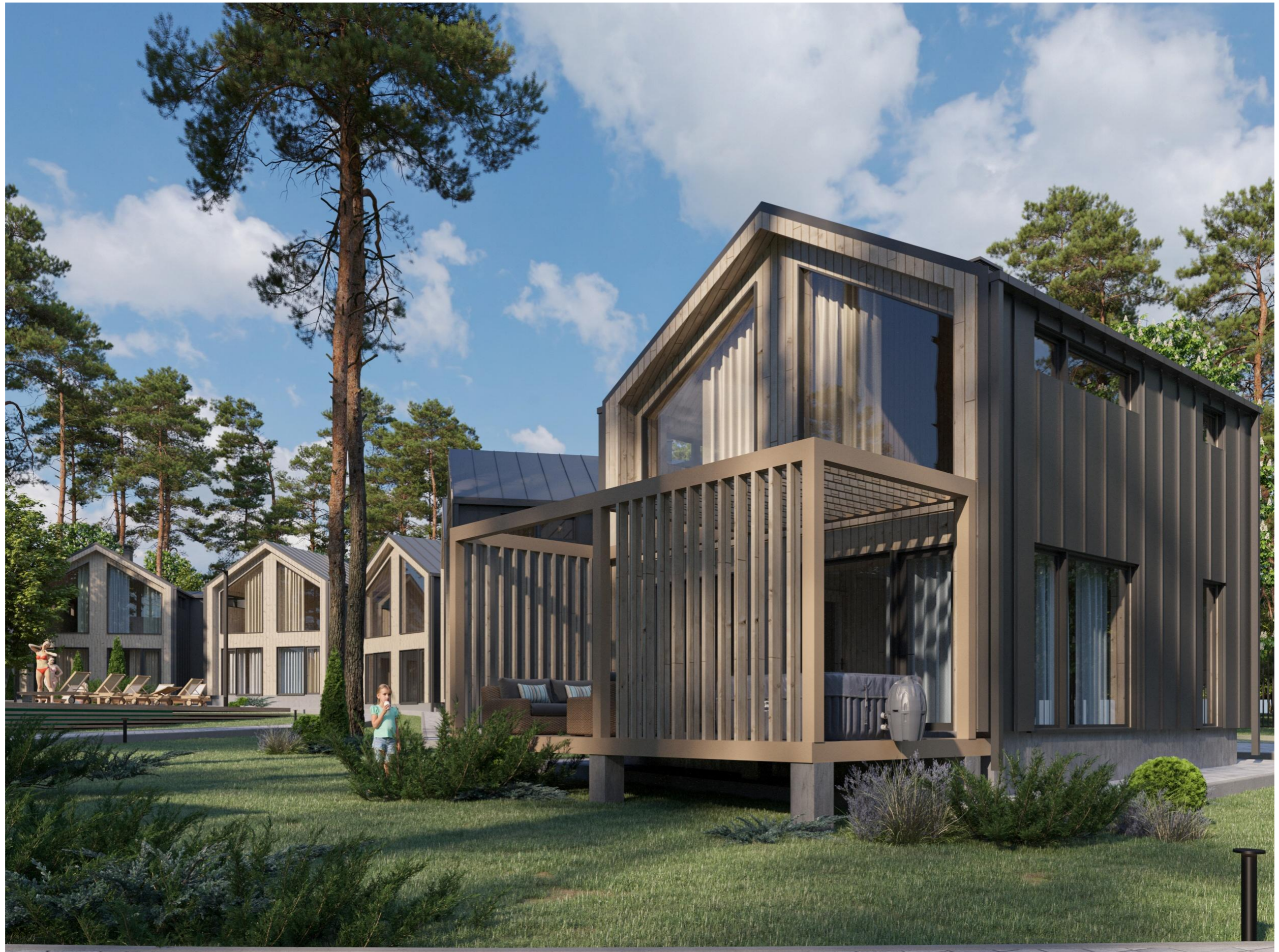
Перспективное изображение Вид 8