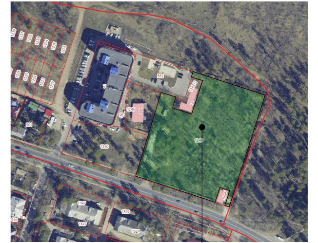
Участок под малоэтажную застройку