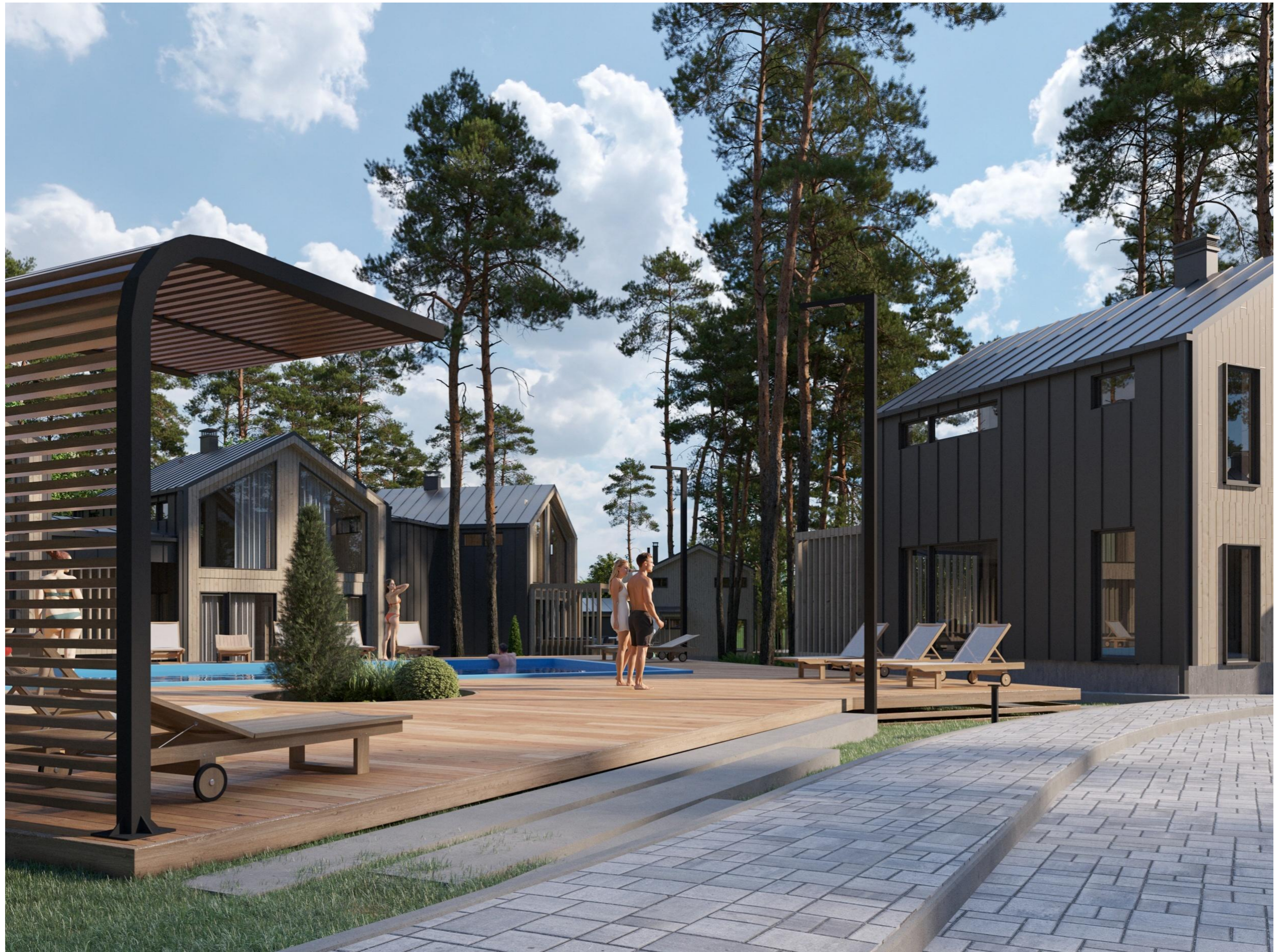
Перспективное изображение Вид 4