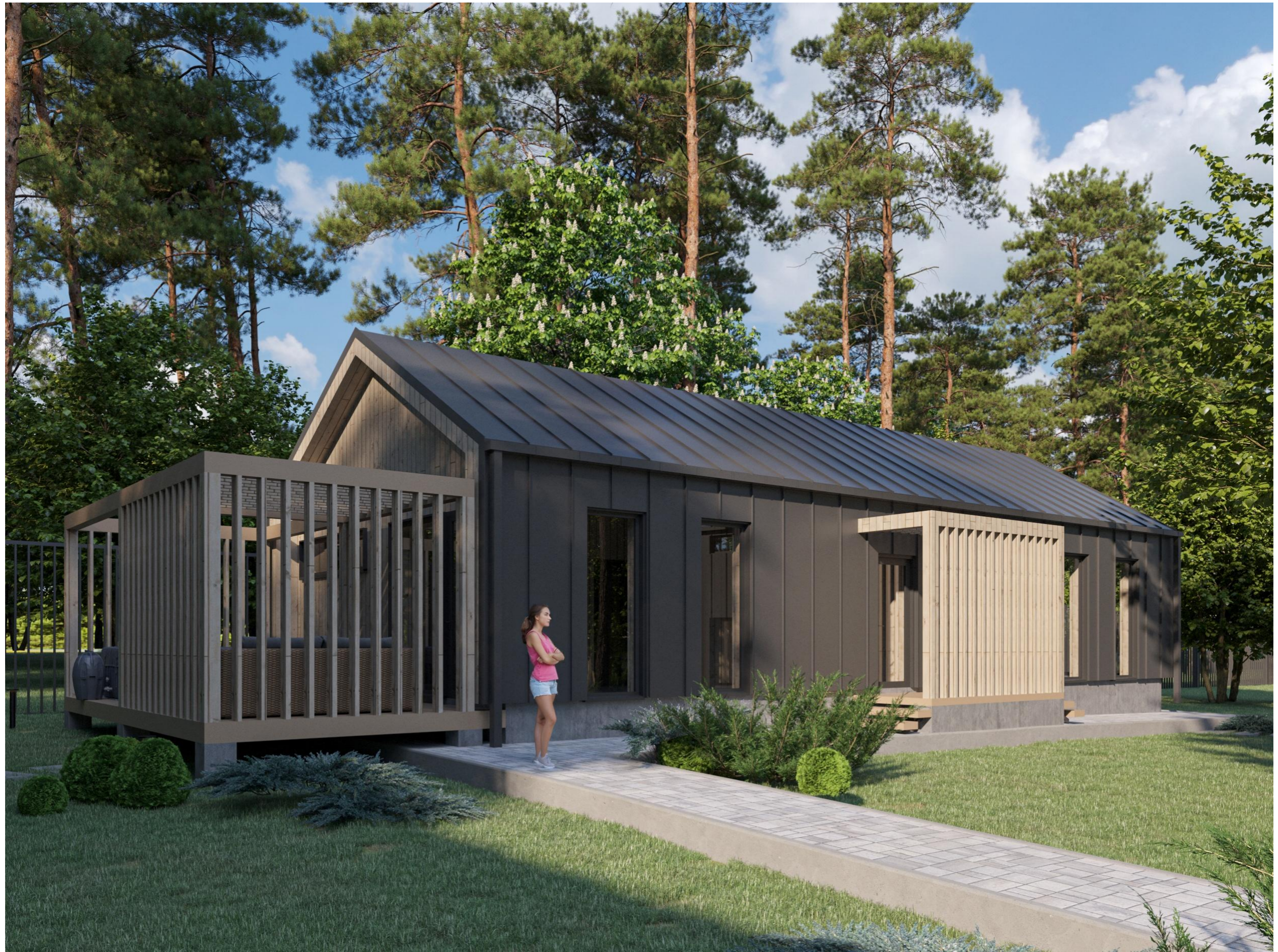
Перспективное изображение Вид 6