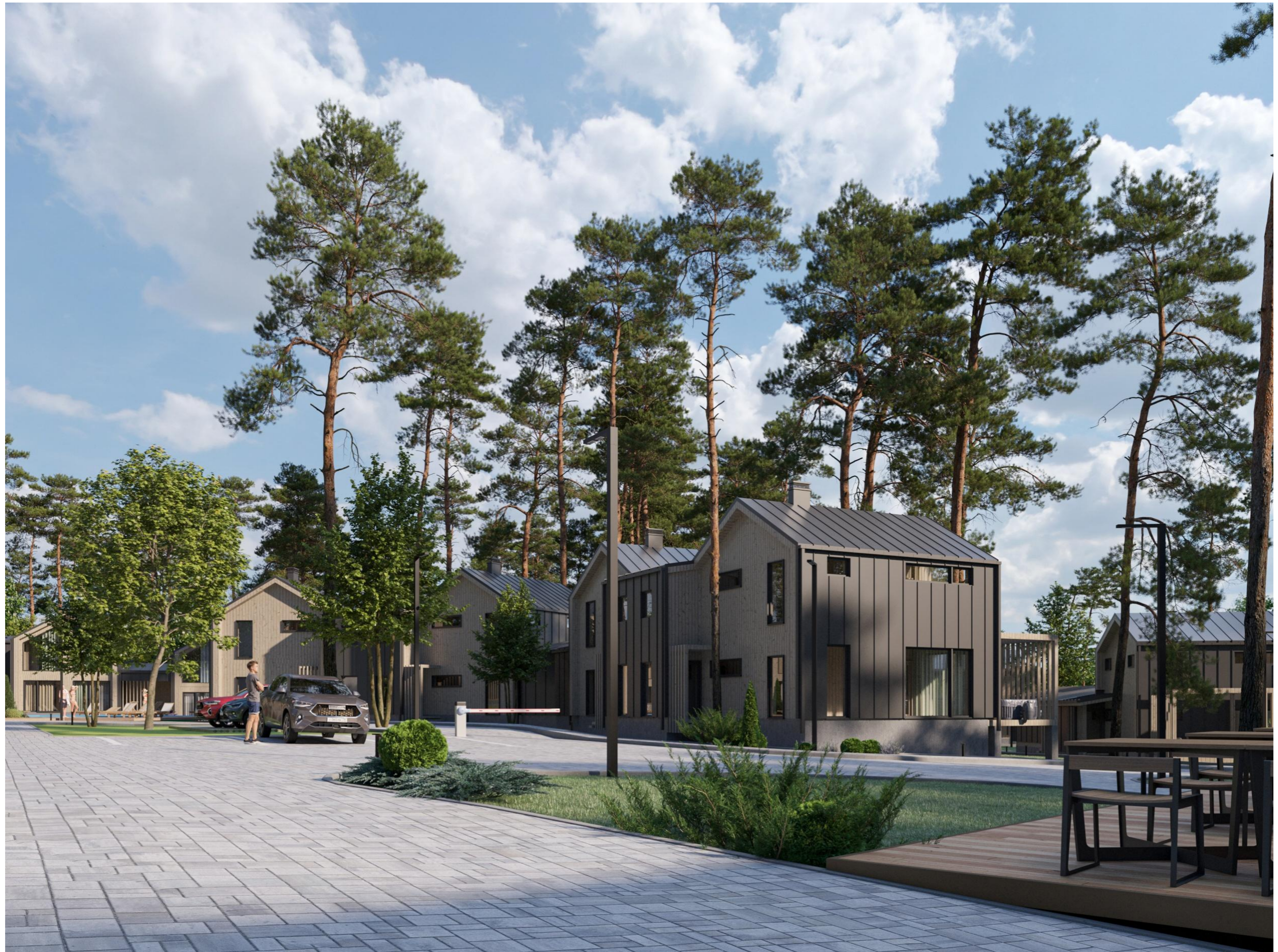
Перспективное изображение Вид 3