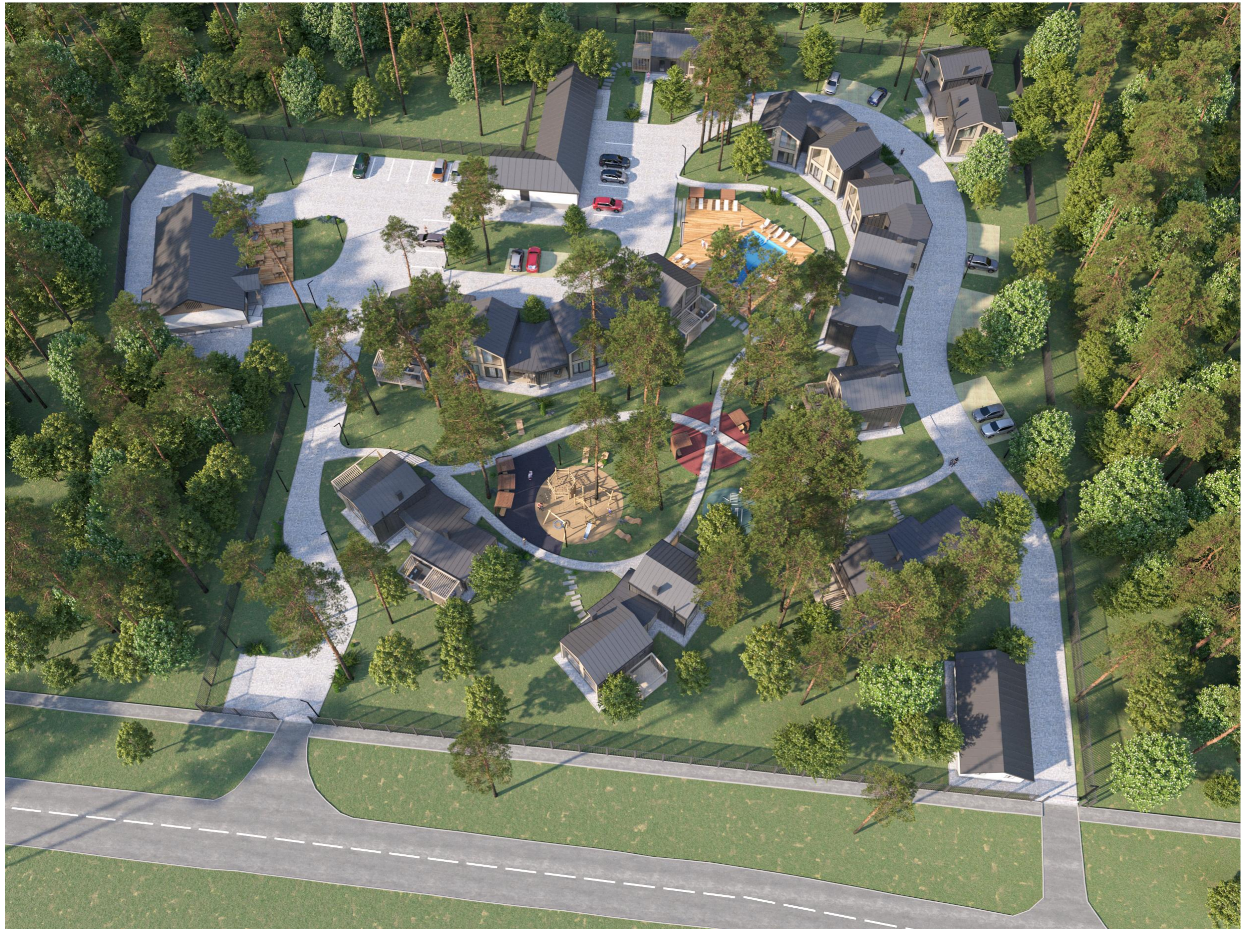
Перспективное изображение Вид 1