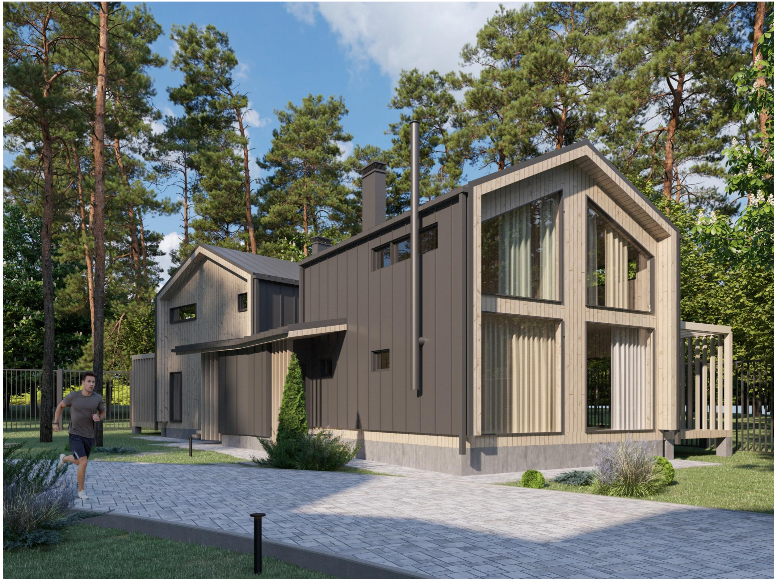
Перспективное изображение Вид 7