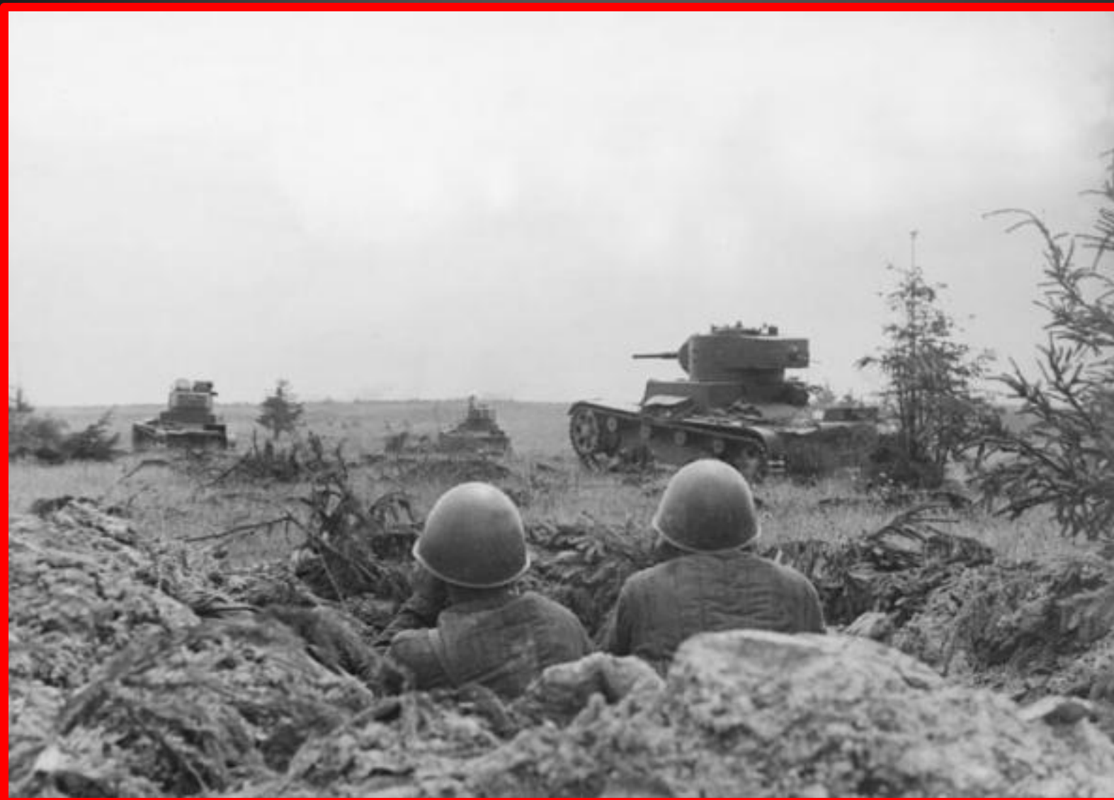
Танковая атака 1941 г.