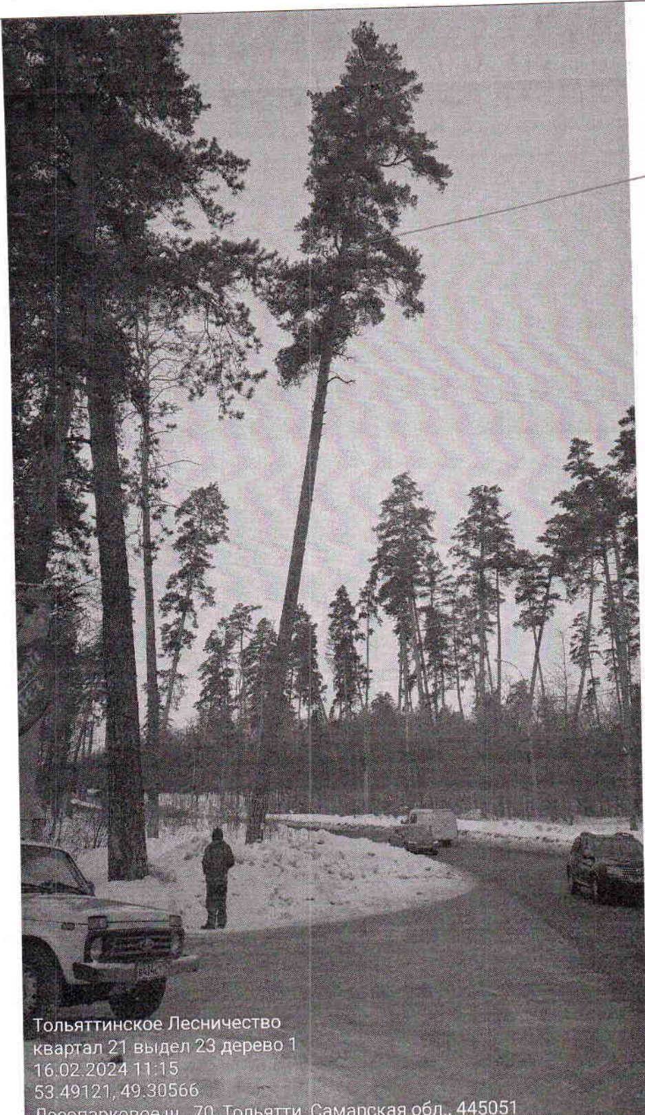
Тольяттинское Лесничество квартал 21 выдел 23 дерево 1 16.02.2024 11:15 53.49121, 49.30566 Лесопарковое ш., 70, Тольятти, Самарская обл., 445051