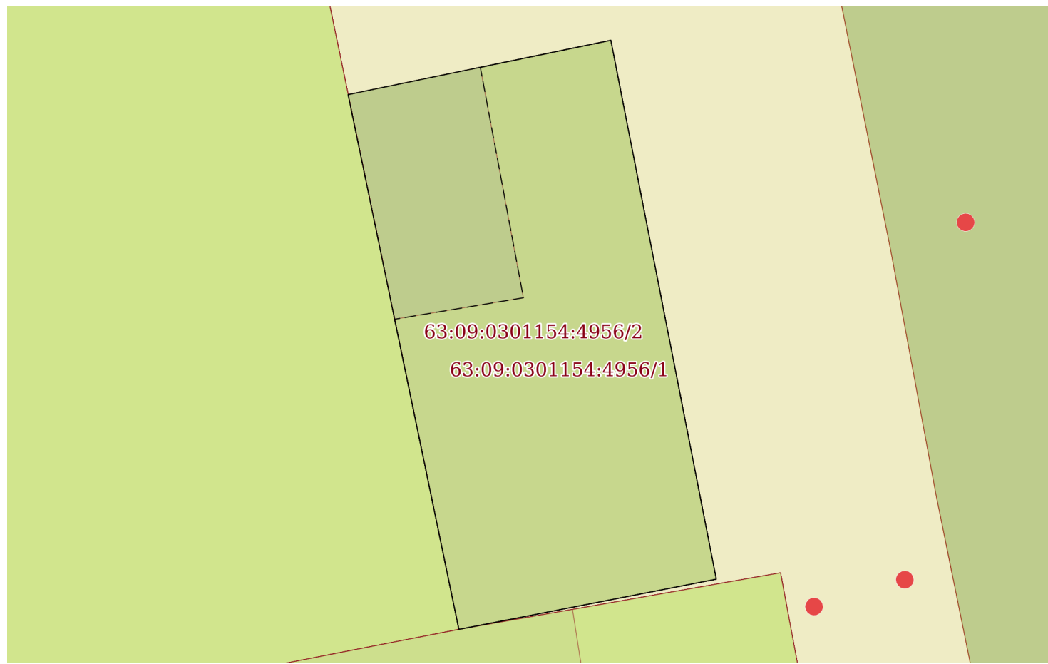
План (чертеж, схема) земельного участка