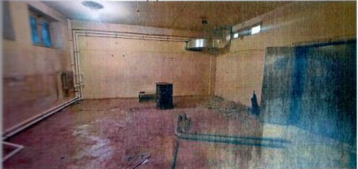
Фотографии объекта оценки