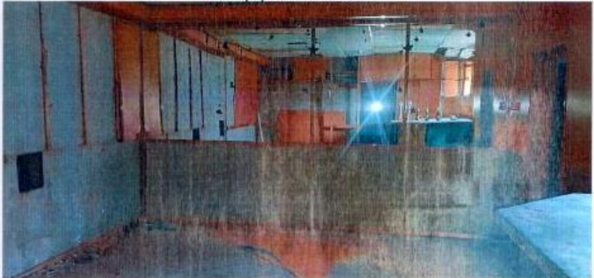
Фотографии объекта оценки

и данных с доставлены проведения убликована ответствующих