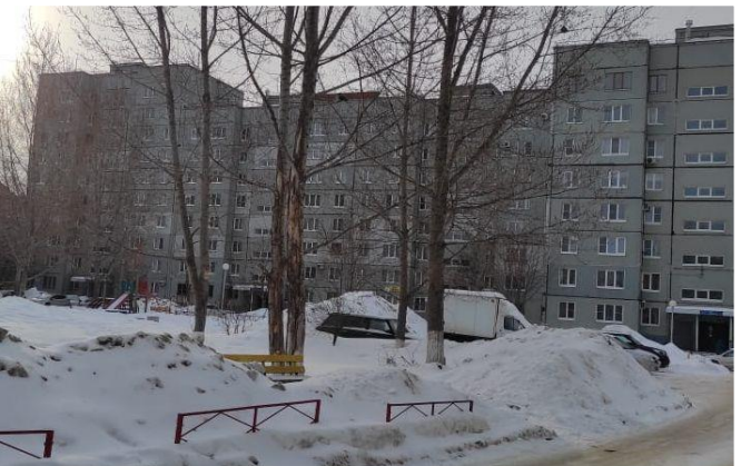
Фото объекта «ДО»

Департамент гор. хозяйства: Стражец Н.С. Т.54-31-68