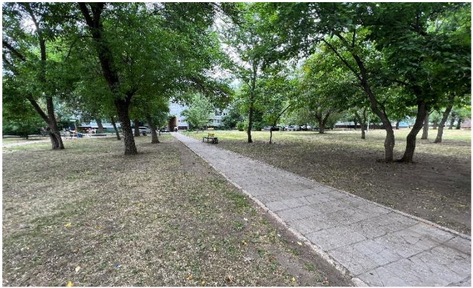
Фото объекта «ДО»

Департамент гор. хозяйства: Стражец Н.С. Т.54-31-68