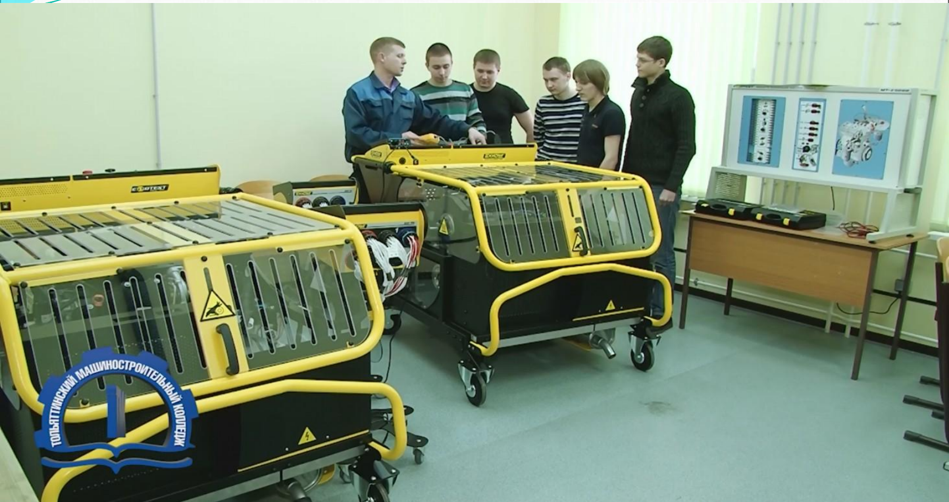
Межрегиональный отраслевой ресурсный центр в Технопарке. Урок производственного обучения