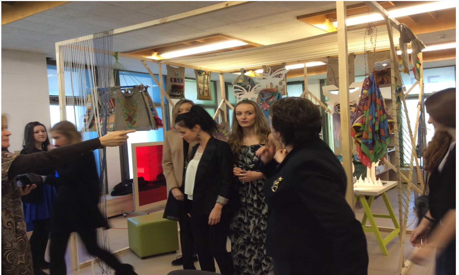
2014г. Фестиваль «РУССКИЕ СЕЗОНЫ»