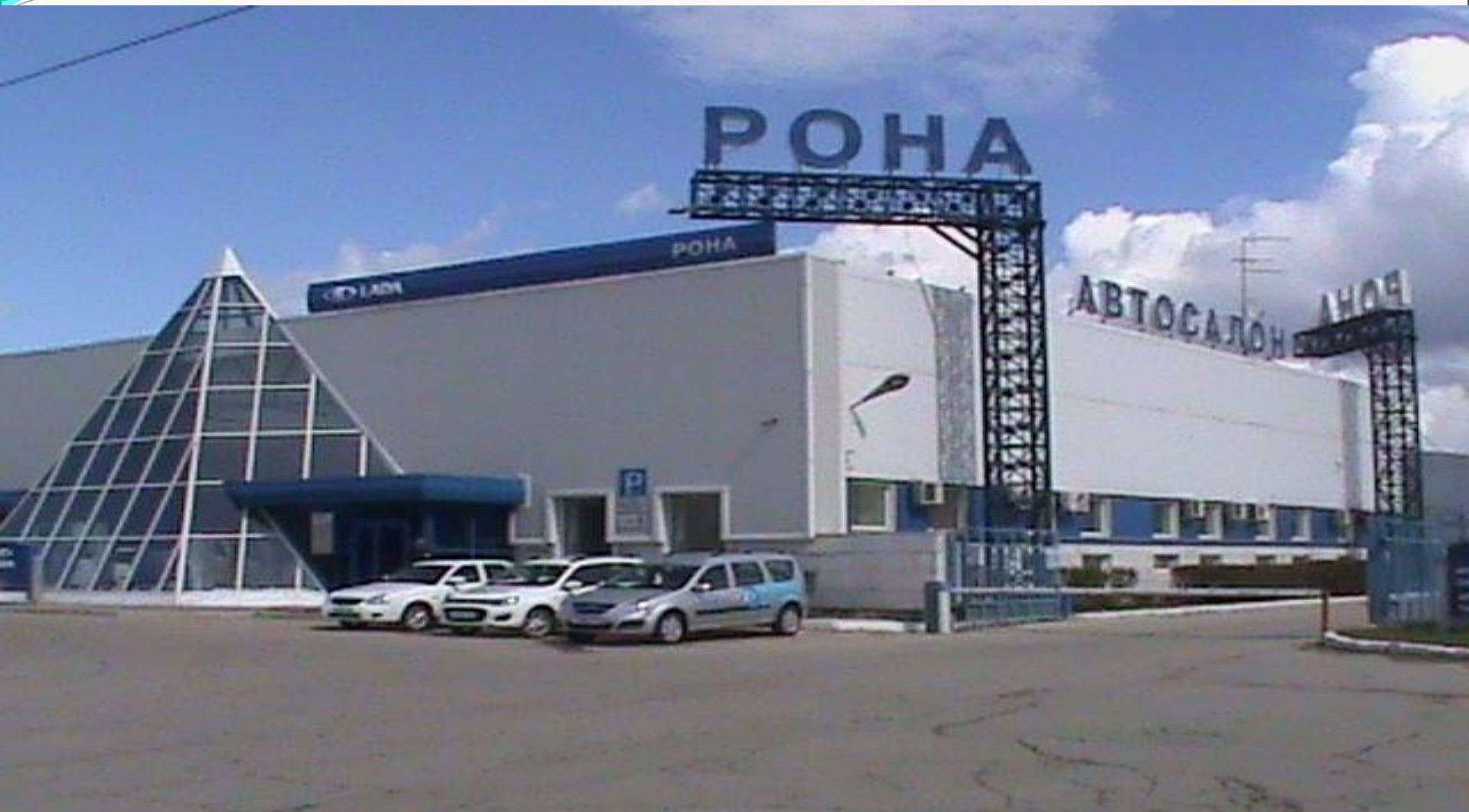
ООО «РОНА» (дилерский центр ОАО «АВТОВАЗ»). Стажировка по специальности