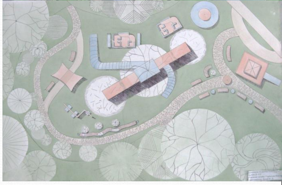
Совместный проект генерального плана парка