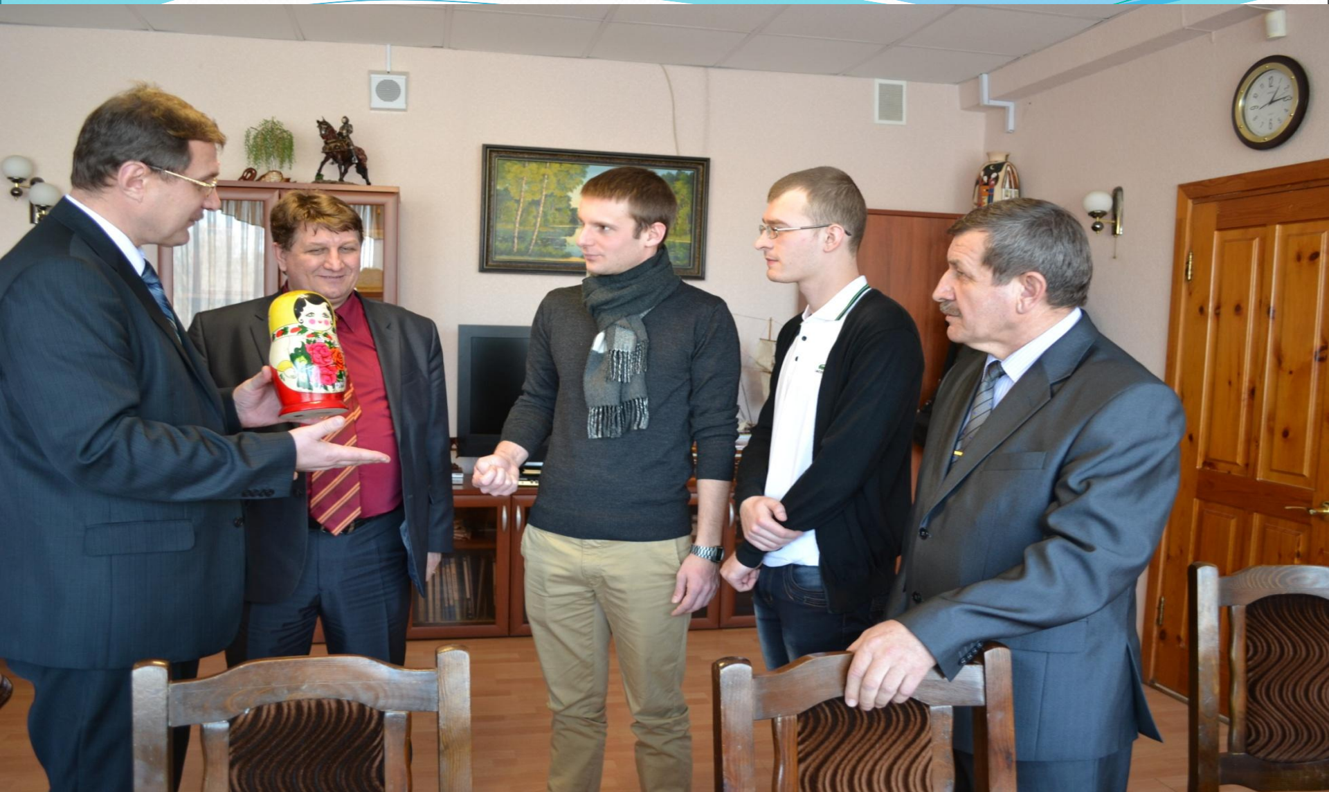
Февраль 2013г. Стажировка первого студента из Школы ГАРАК в ТМК «Русская матрешка» на память