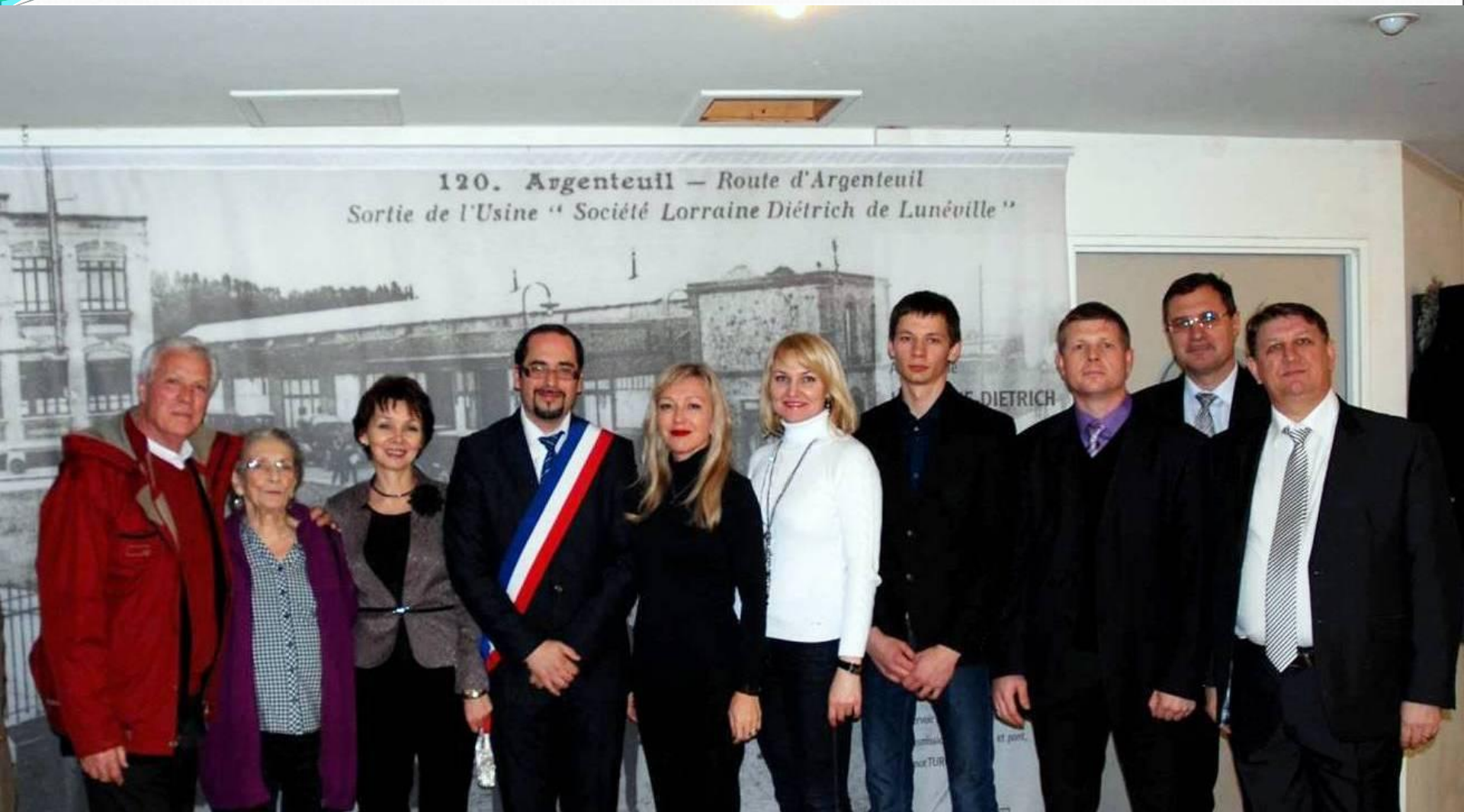
Приём официальной делегации г.о. Тольятти в мэрии г.Аржантёй