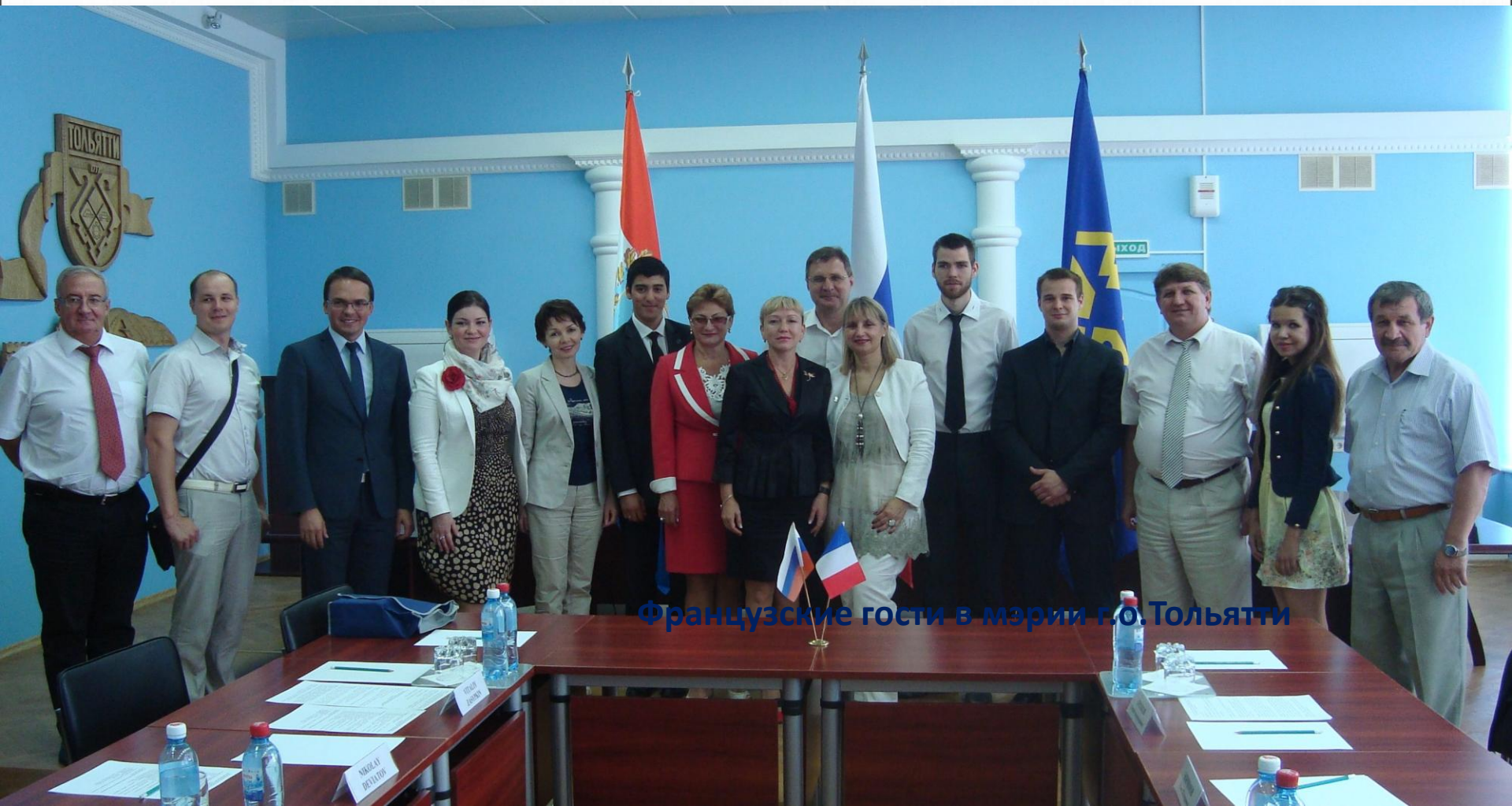
Французские гости в мэрии г.о.Тольятти