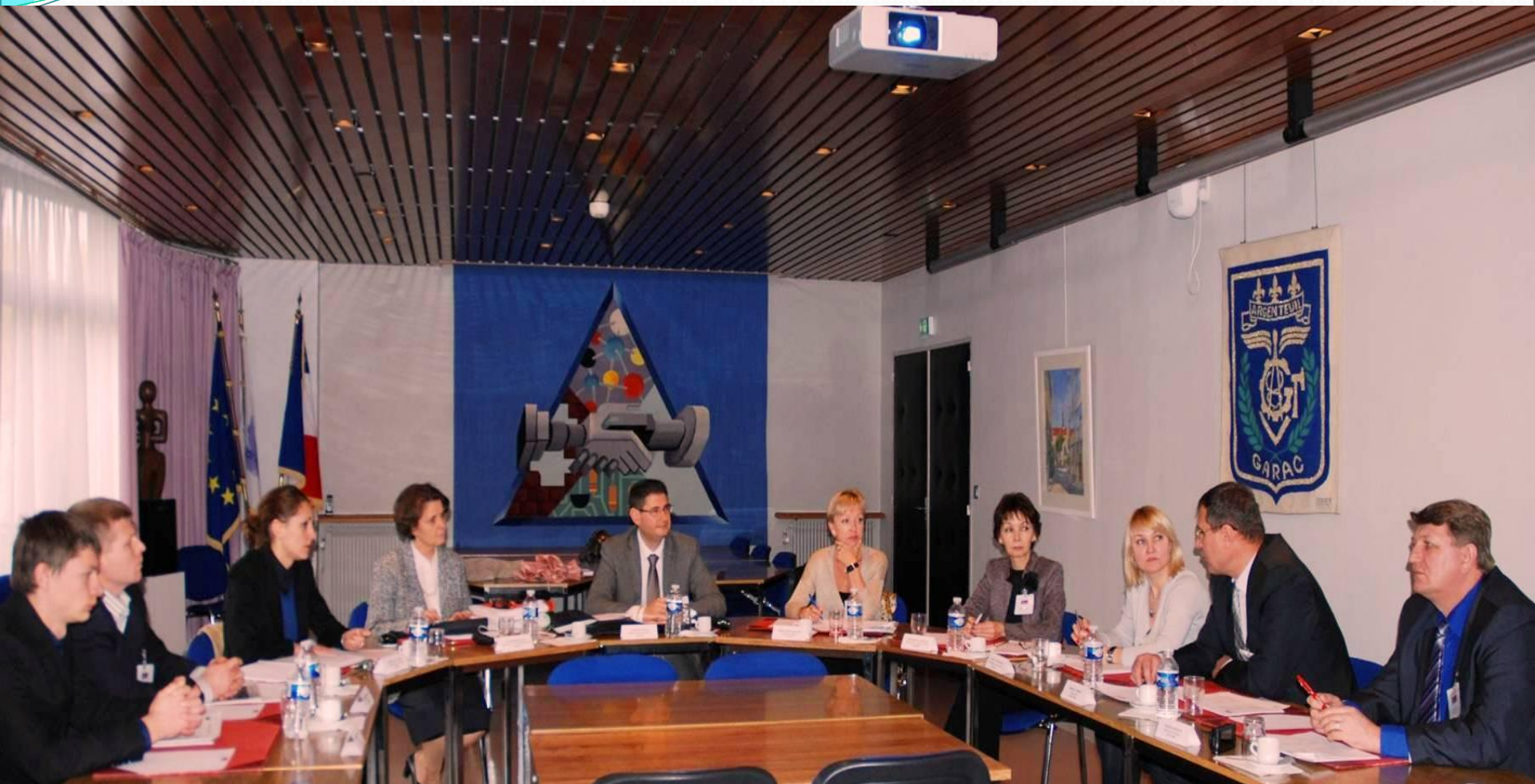
Рабочая встреча в школе GARAC