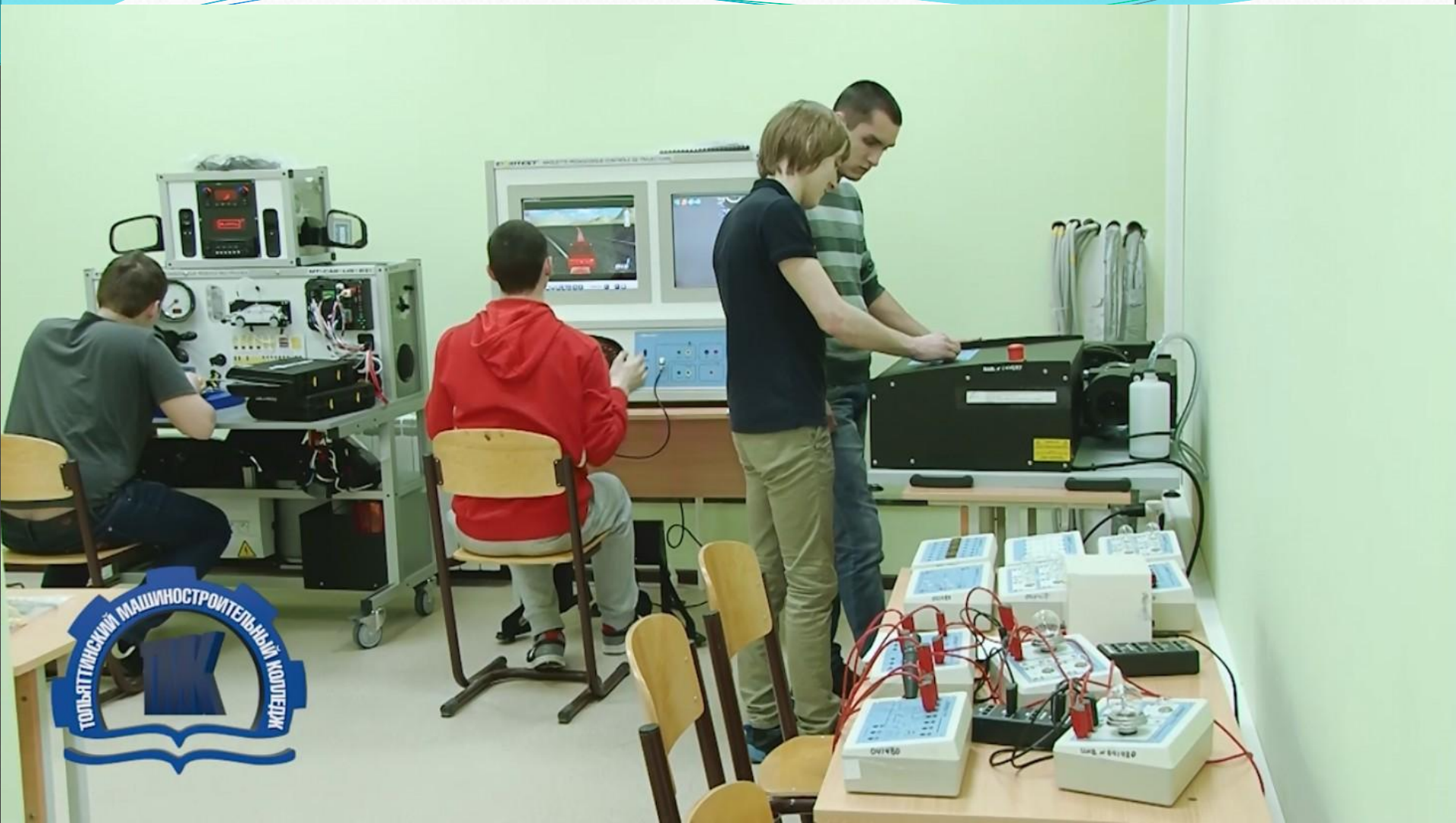
Технопарк «Жигулёвская долина» (МОРЦ) Лабораторная работа