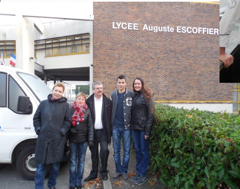
Стажировка и мастер-классы в г.Эраньи