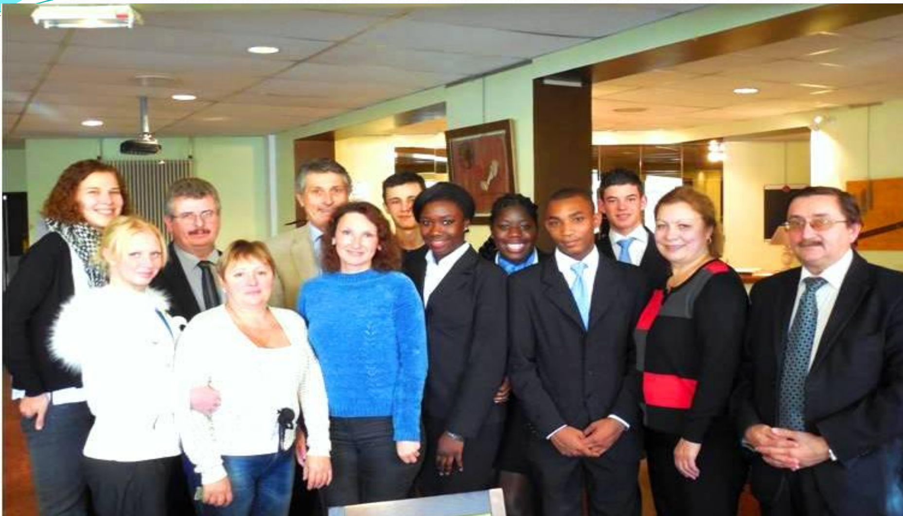
Делегация студентов и преподавателей в лицее Огюста Эскофье