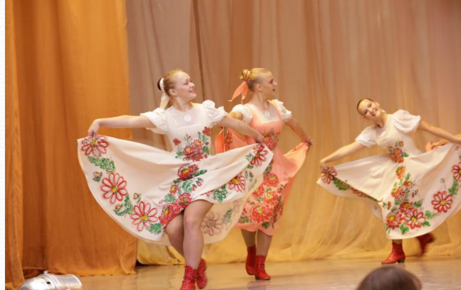
Народно-сценический танец: обучение студентов лицея К.Клодель