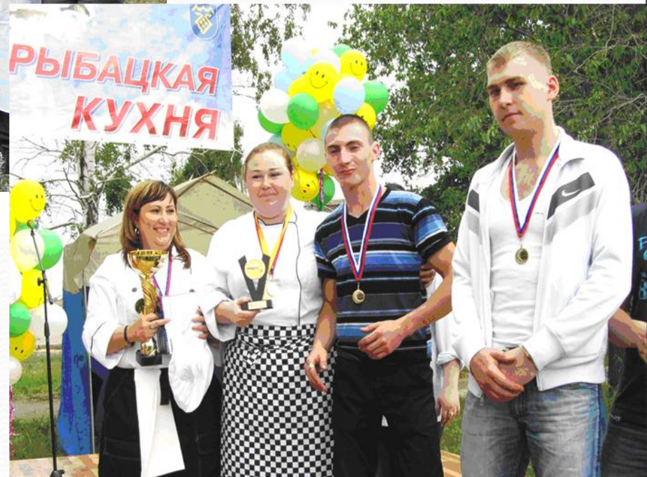
Участие французской команды в конкурс е«Рыбацкая уха»