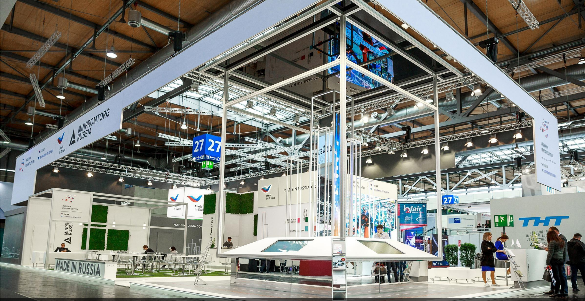
КОЛЛЕКТИВНЫЙ СТЕНД РЭЦ