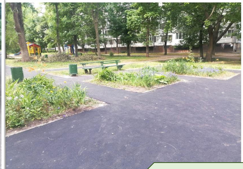
Фото объекта «После»