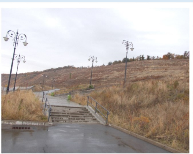
Фото объекта «До»