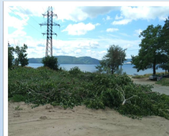
Фото объекта «В работе»