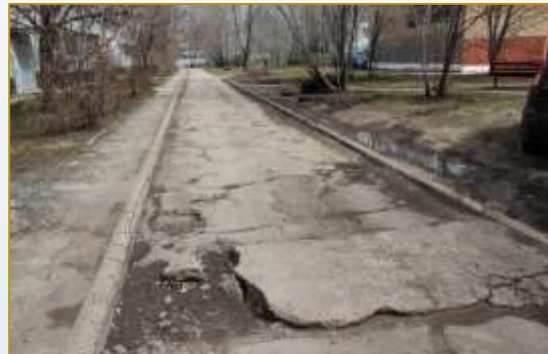
Фото объекта «До»