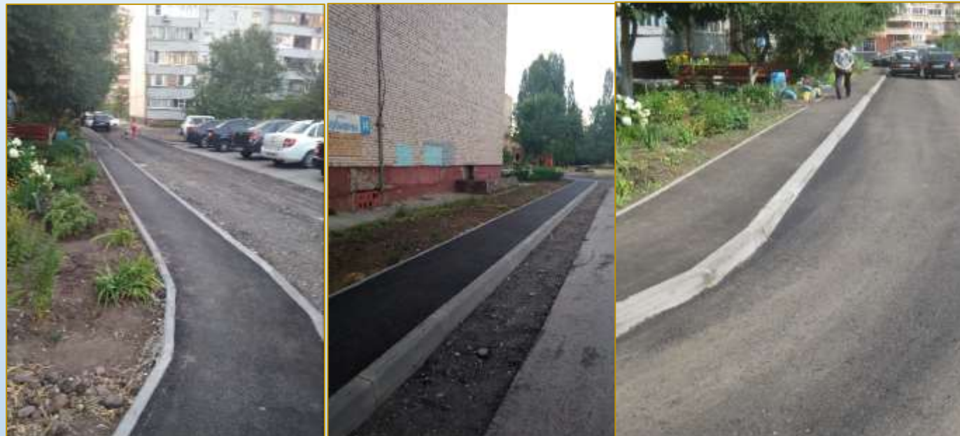
Фото объекта «В работе»