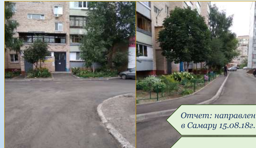
Фото объекта «После»