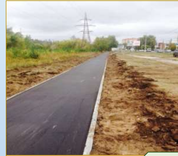
Фото объекта «После» Договор оплачен