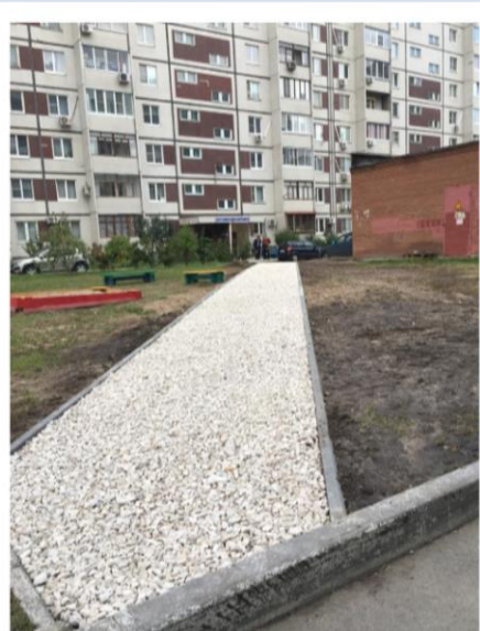
Фото объекта «В работе»