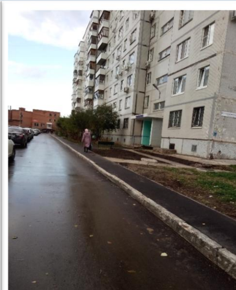
Фото объекта «После»