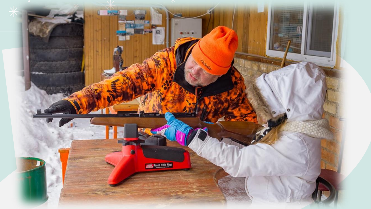
Стрельба в Ловчем это